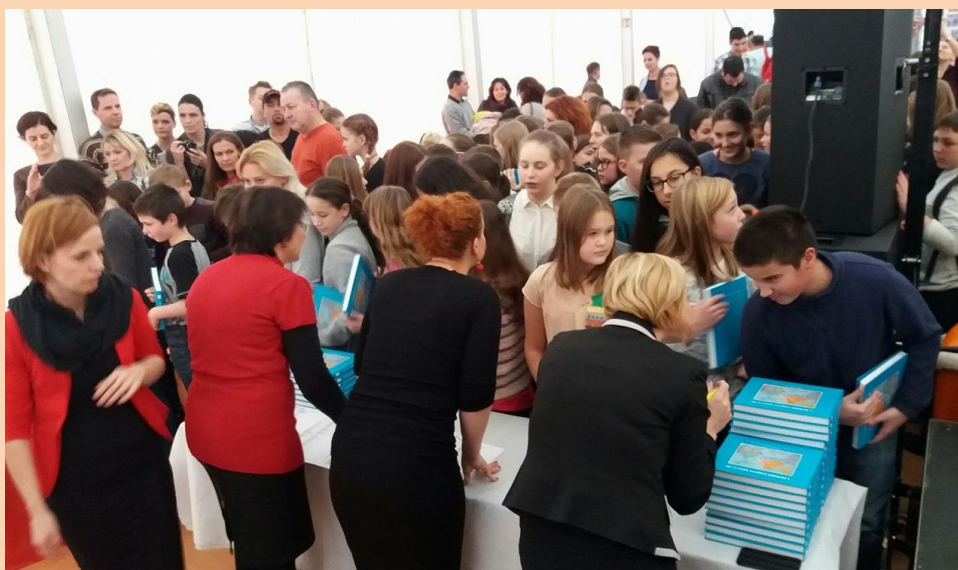
A különdíjas gyerekek átveszik a könyvet...

A Gyermekrajz-pályázaton az FKF Nonprofit Zrt. a kreatív és alkotni vágyó gyerekeknek adott teret gondolataik, ötleteik megformálására, megrajzolására, modell- és makett-készítésre. Az alkotásokat a zsűri elnöke, Fábíán Noémi képzőművész, a Moholy-Nagy Művészeti Egyetem és a Budai Rajziskola tanára, valamint az FKF Nonprofit Zrt. Edukációs Csoportjának munkatársai értékelték. A legjobb pályaműveket beküldő tanulók értékes díjakban részesültek.